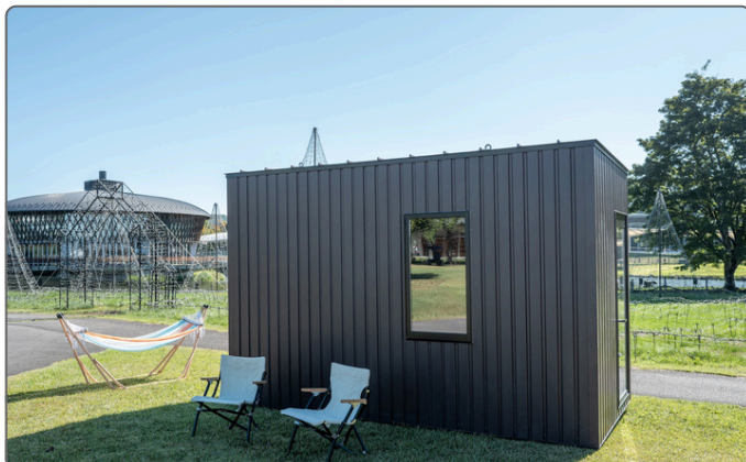
災害対応車両登録制度の要件を満たした 木造の小屋「MokuSeed(モクシード)」