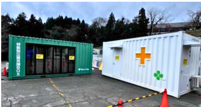
被災地での設置作業の様子（設置型コンテナの場合）

2024年の能登半島地震においては、政府（内閣官房国土強靱化推進室）からの要請を受け、当社の医療用コンテナ「モバイルクリニック」を被災地へ移設・設置いたしました。「8R」の思想で設計されたコンテナは、過酷な環境下でも迅速に設置でき、プライバシーと衛生環境を確保することで、多くの被災者の方々の心身のケアに貢献しました。この現場での経験と実績が、今回の宇都宮市との協定にも活かされています。