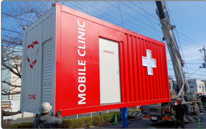
能登半島地震へ医療コンテナを移設

1. 医療用コンテナ「モバイルクリニック」 陰圧設備や空調を完備し、感染症対策に対応した個室空間です。発災直後の救護所としてはもちろん、プライバシーが守られた健康相談室としても機能します。