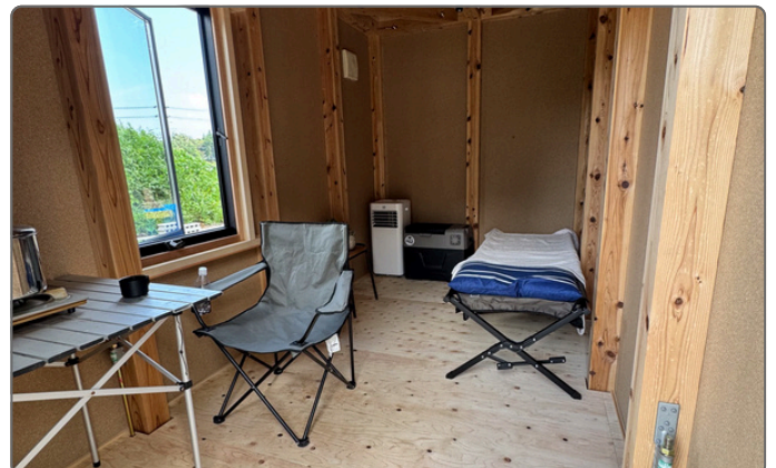
避難所としての活用はもちろん、 ユニットバスを施工した宿泊所にもなる